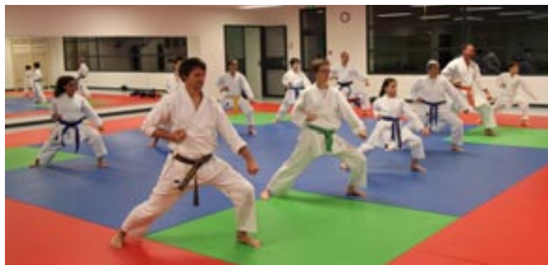
Cours d'entraînement des adultes

Venez découvrir cette activité, le Karaté Club vous propose deux cours d'essai gratuits..