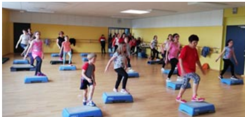
Atelier Step durant la Fête du Sport, le 8 mai 2019

Tous les cours sont ouverts aux femmes et aux hommes.