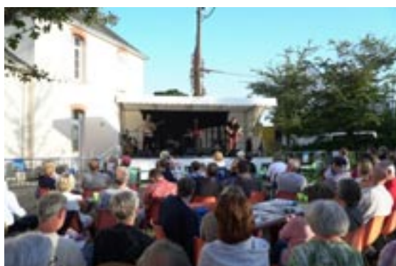
Une belle affluence pour les Apéros Klam