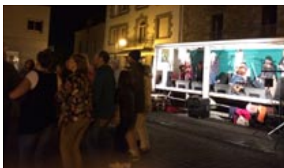
Les danseurs ont été fidèles aux marchés nocturnes malgré le vent et parfois même la pluie !