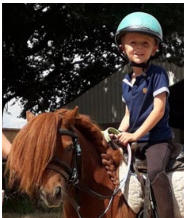
Noa sur Karamel, un gentil shetland de 8 ans offert par l'association au centre équestre cet été.

Concours de saut d'obstacles dimanche 20 octobre et de dressage dimanche 8 décembre à Pluvigner : l'occasion de découvrir ces disciplines et apprécier les reprises des cavaliers. Entrée gratuite.