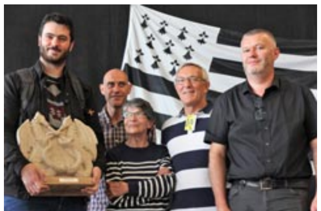
Remise du trophée "Yvon Palamour" aux vainqueurs du concours de sonneurs du festival Breizh au Gallo 2019

• 3 ème édition du festival Breizh au Gallo à la salle Le Borgne les 19 et 20 septembre 2020 .