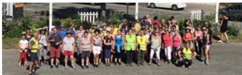
Les Randos ont connu un beau succès avec une soixantaine de personnes chaque lundi.

Autres temps forts, les Apéros Klam ont rythmé l'été et ont vraiment trouvé leur place dans le paysage pluvignois. Ils ont connu chaque fois un grand succès et ce partenariat avec le Collectif Klam devrait être reconduit l'année prochaine pour le plus grand plaisir de tous.