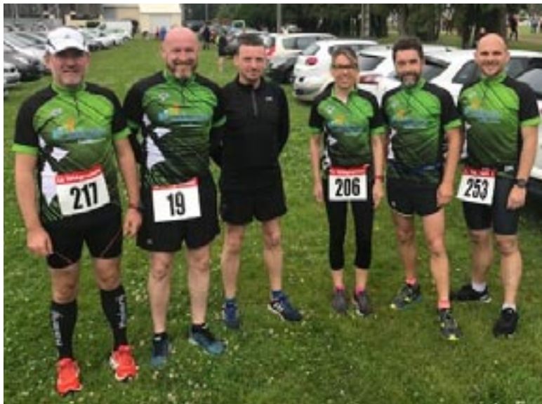
Les Foulées Pluvignaises à Erdeven

Pour maintenir une ambiance sportive et amicale à laquelle les membres de l'association attachent une grande importance, ils organisent durant l'année plusieurs moments festifs (galette des rois par exemple) pour le simple plaisir de se retrouver.