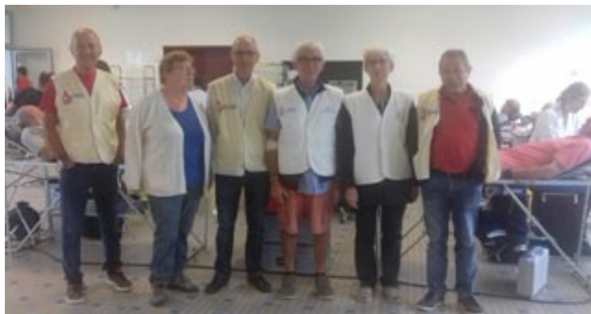
Quelques bénévoles lors de la collecte du 14 août, où 102 donateurs se sont présentés !

Un grand merci aux donateurs et à la mairie qui a décidé cette année de permettre au personnel communal de participer à la collecte sur leur temps de travail. Merci aussi à la société Hill-Rom qui libère également son personnel.