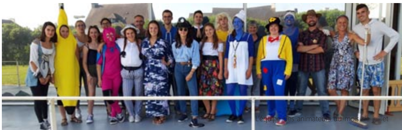
L'équipe des animateurs du mois de juillet