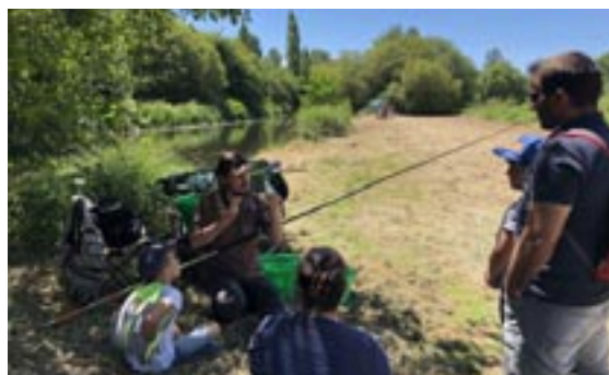
L'initiation à la pêche a fait le bonheur de petits et grands dans un cadre particulièrement agréable.