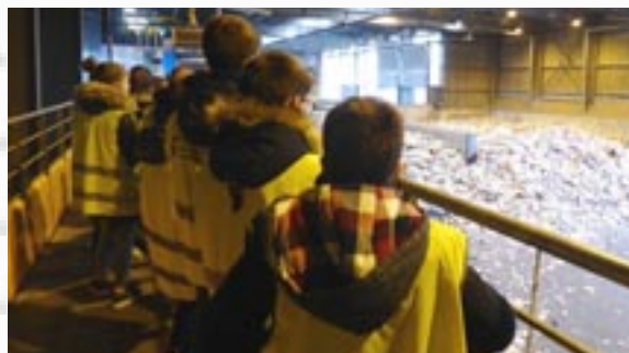
Visite du centre de tri de Vannes