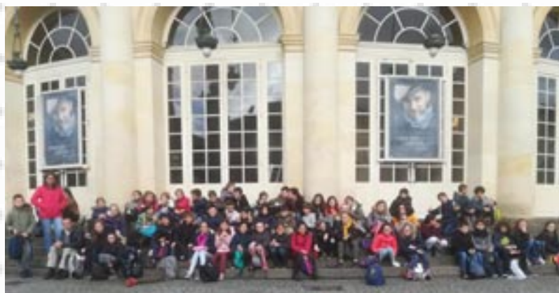
Opéra de Rennes