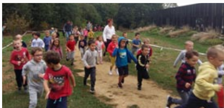
Bravo aux parents qui n'ont pas hésité à accompagner les enfants dans l'effort !