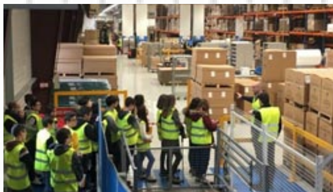
Visite de l'usine Hill-Rom dans le cadre du dispositif "classe en entreprise"

• Un travail de liaison avec les écoles primaires et les lycées pour améliorer le suivi et la réussite des élèves avec une journée de découverte du collège pour les élèves de CM2.