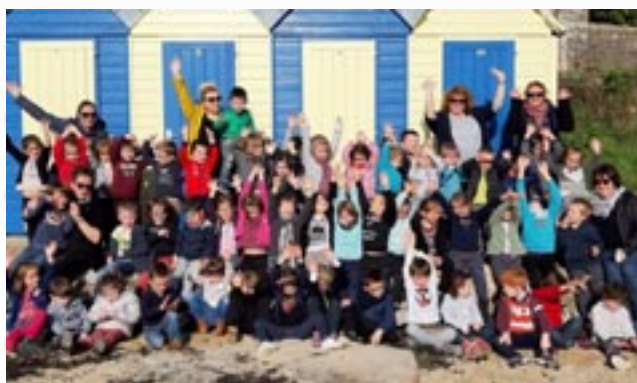
Classe de mer à Larmor-Baden