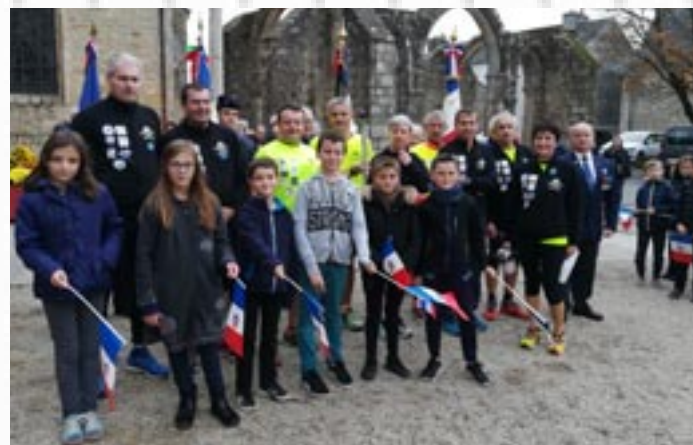
Participation aux cérémonies de commémoration