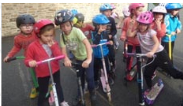
"Roule & Glisse" pour s'initier à la trottinette