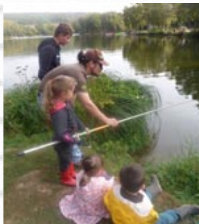
A la découverte des joies de la pêche