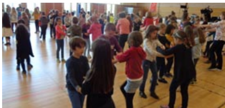
Bal du monde