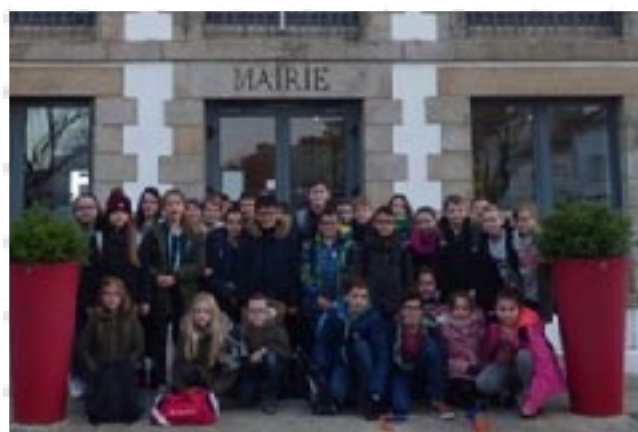
Visite à la mairie pour un travail sur les archives communales

• Cette année encore, les élèves de CM1/CM2 ont participé au concours du souvenir français sur le thème "Le ou les monuments aux morts de notre commune". Un travail très enrichissant a été mené d'octobre à mars, les élèves se sont rendus à la mairie de Pluvigner pour travailler sur les archives de la commune avec l'aide de bénévoles de l'association Pluvigner-Patrimoines. Ils ont appris beaucoup sur le monument aux morts de Pluvigner. La classe termine 1 ère du concours pour le comité Auray-Pluvigner et une délégation de 4 élèves se rendra en juin à la Préfecture pour la remise départementale des prix !