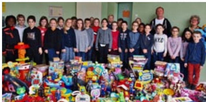
Opération "Un jouet pour nourrir un enfant"