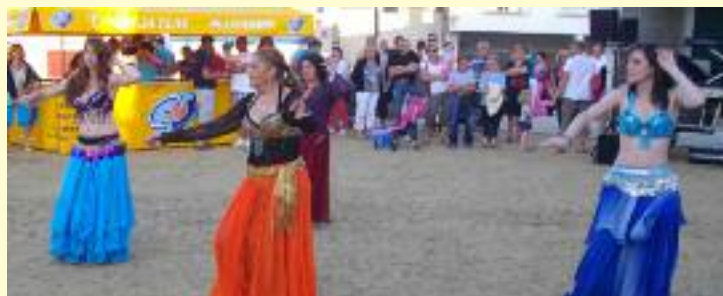
Warda à la fête de la musique

Une fiche d'inscription est disponible sur le site de Pluvigner / association Warda.