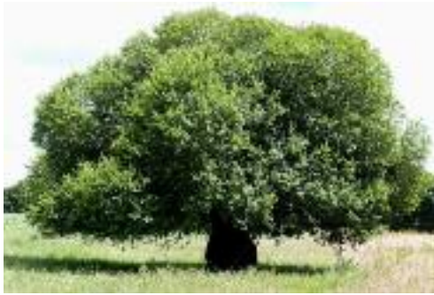
Saule Strabon présent sur la commune de Pluvigner

A partir de cet inventaire, le groupe de travail a proposé un classement permettant d'établir des modalités de protection et de gestion durable afin d'assurer la pérennité et maintenir les fonctionnalités de ce patrimoine.