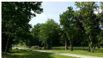
Venez flâner dans le parc de Keronic

Le plan de Pluvigner est disponible à l'office de Tourisme pour vous aider à localiser les chapelles.