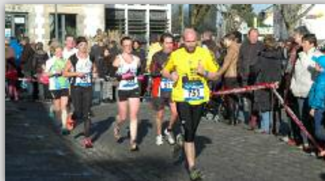
Comme tous les ans, les Foulées 2014 ont attiré de nombreux adeptes de la course à pied.

L'édition 2015 des Foulées Pluvignaises aura lieu début février.