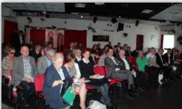
Les 56 élus communautaires étaient invités à participer à un premier séminaire de travail le 23 mai dernier pour lancer les projets de l'intercommunalité.

Elles se rassemblent au sein de 15 grands domaines de compétences, chacun étant porté par un Vice-Président délégué de la communauté de communes :