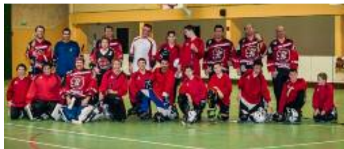
Les équipes ados et adultes de hockey

Contact : rollerscop.s@gmail.com http://roller-cops-pluvigner.over-blog.com/