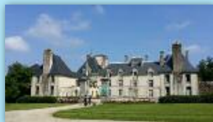
Le parc du château de Kéronic sera ouvert durant les Journées du Patrimoine