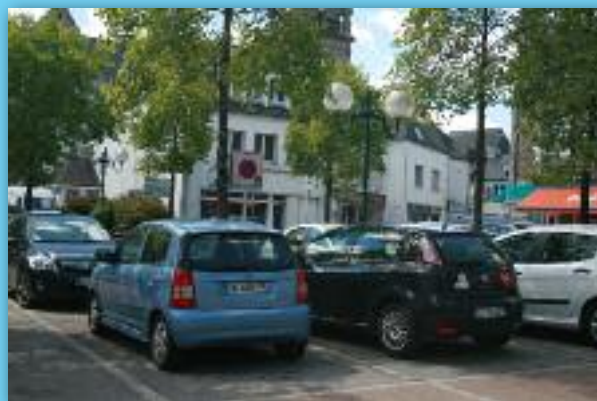
La zone bleue de la place du Marché

→ Suite à une rencontre avec les commerçants, nous allons travailler sur le respect de la zone bleue pour permettre un meilleur stationnement, plus fluide, pour la fin de l'année, sur les places du Marché et de St Michel. Des places pour les commerçants et personnels des commerces seront réservées sur l'espace du parc St Michel. Un fléchage des différents parkings du centre-ville sera par ailleurs réalisé. Nous devons, en parallèle, mener une réflexion sur l'aménagement de lieux de déplacement des personnes à mobilité réduite (PMR) pour leur permettre de se déplacer en toute sécurité dans le centre-ville (passage piétons, trottoirs adaptés...).