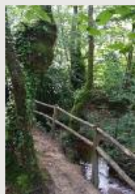
Brec'h - Pluvigner par les chemins...