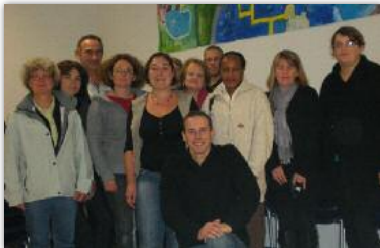
Les membres du conseil d'administration vous donnent rendez-vous à 20h30 le 26 septembre pour l'assemblée générale de l'association.

Le rôle de l'Amicale Laïque au sein de l'école Joseph Rollo est de permettre à tous les enfants de l'école de bénéficier d'activités variées en apportant un soutien financier pour l'achat de divers matériels et la réussite de plusieurs projets culturels.