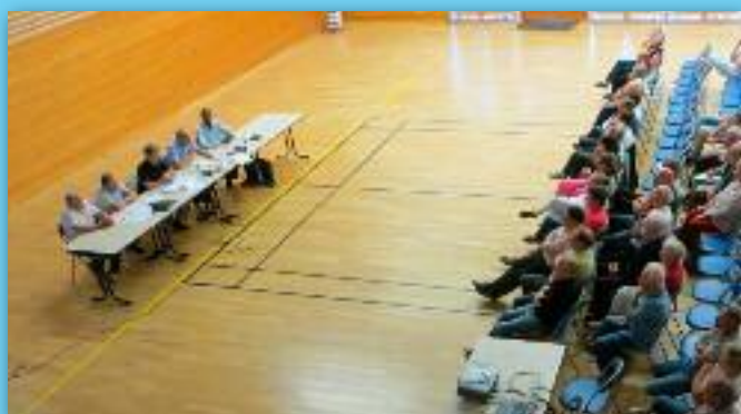
Réunion publique PLU du 2 juillet 2014

→ En effet, il nous a fallu relancer le PLU (Plan Local d'Urbanisme) que nous devons clôturer dans les 18 mois. Je tiens à remercier les membres de cette commission PLU qui ont dû régulièrement se réunir cet été et travailler à la définition du Projet d'Aménagement de Développement Durable (PADD) pour le présenter à la population (début octobre) avant d'être débattu par le conseil municipal (fin octobre).