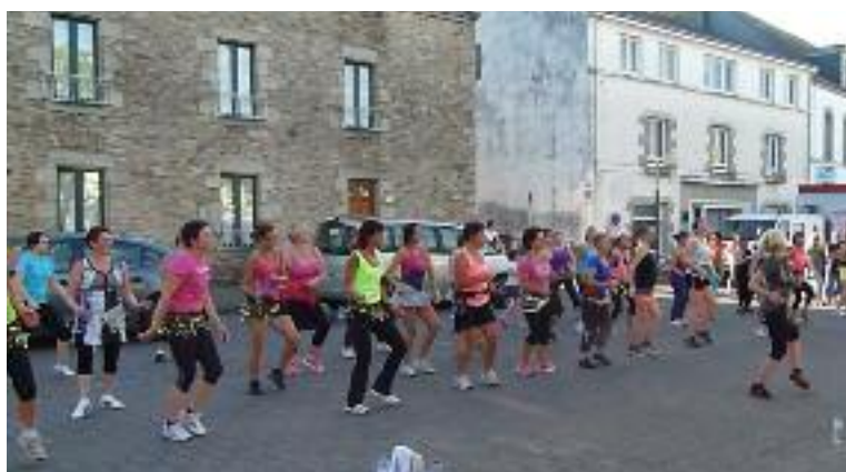
Cours de Zumba géant lors de la fête de la musique dans le bourg de Pluvigner

L'Association "Les Gymnastes Pluvignaises" organise, en collaboration avec "Les Foulées Pluvignaises", une rando pédestre début février 2015.