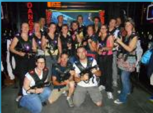
Les joueurs de Pluvi'Bad ont fêté la fin de leur année sportive par une sortie " Laser game"