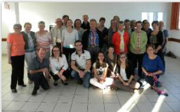
Vous voulez vous initier ou vous perfectionner aux danses bretonnes? Alors rejoignez vite Koad ha mor!

Pour fêter leur quart de siècle, les membres de l'association vous invitent à leur fest noz animé par Arvest et le duo Yves le Guennec, Blain / Leyzour le 25 octobre à partir de 21h00 à la salle le borgne.