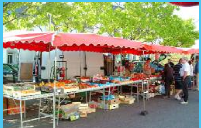
Depuis le samedi 16 août, le nettoyage de la zone du marché est effectué par les services techniques.