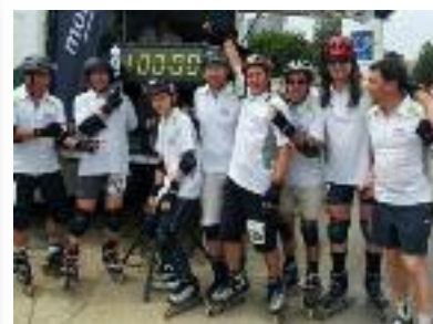
L'équipe de Pluvigner prête pour la Grol Race

Consultez le blog des Rollers Cop's pour prendre connaissance des horaires des cours de rollers et hockey.