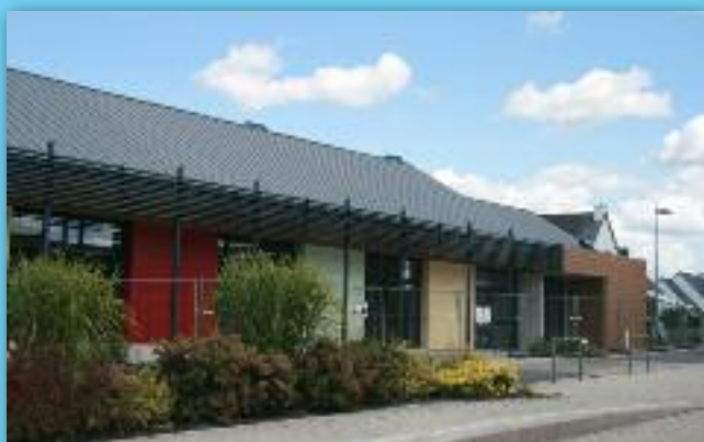
2 Le nouveau restaurant scolaire sera mis en service en janvier 2015

→ Un comité de pilotage a été mis en place pour organiser les nouveaux rythmes scolaires à cette rentrée. Si les parents d'élèves et enseignants se sont investis dans ce projet, le personnel du service jeunesse et l'adjointe aux affaires scolaires n'ont pas non plus compté leur temps pour mener à bien ce projet. Il est évident que cette organisation connaîtra des modifications et adaptations si cela se révèle nécessaire lors de sa mise en œuvre.