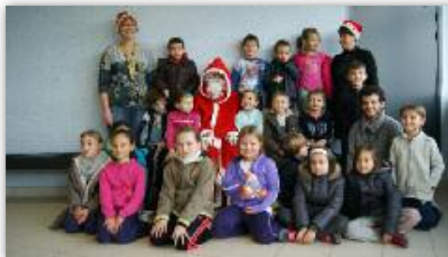
Une partie des enfants du Multisport à la fête de Noël en décembre 2013.

Le PBB compte également une section multisport ouverte aux enfants de 5 à 8 ans. Cette section est idéale pour les enfants qui ont envie de faire une activité sportive mais qui ne savent pas particulièrement quel sport pratiquer. Ils ont ainsi l'occasion de tester le basket-ball, le badminton, la gymnastique, l'athlétisme, les rollers et enfin les jeux d'extérieur (pétanque, palets, moly, frisbee et vortex).