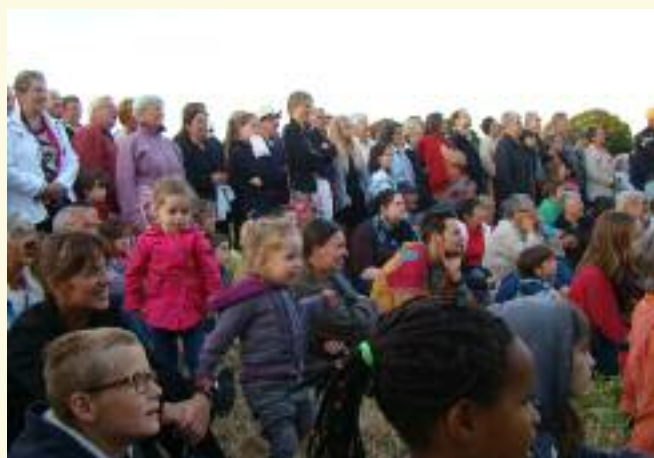
"Pluvigner chante entre les murs", vendredi 11 juillet 2014.

→ d'autres animations ponctuelles, toutes annoncées sur le site municipal et sur celui de l'association : www.kerlenn-sten-kidna.com