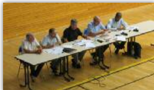
Réunion publique du 2 juillet 2014

L'élaboration du Plan Local d'Urbanisme (P.L.U.) a été relancée au printemps. Ses enjeux et ses objectifs ont été présentés aux Pluvignois en réunion publique le 2 juillet. Fort de l'investissement des élus et du service urbanisme, le dossier avance à grands pas avec, en prochaine échéance, la présentation du Projet d'Aménagement et de Développement Durable. Ce projet détermine l'aménagement de Pluvigner et son développement pour les 10 à 15 prochaines années. Aussi les élus auront-ils le soin de vous le présenter en détail et de mener une concertation riche de rencontres et de débats durant l'automne.