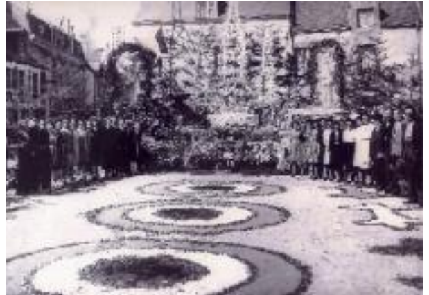
La Place du Marché pose devant le grand reposoir. Dimanche de la Fête-Dieu ; 1943 sans doute

pluvigner-patrimoines@orange.fr 02.97.59.02.05