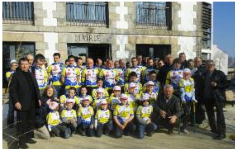
Remise des maillots

3 rue Lann Guerban, 56400 PLUNERET - 06.88.92.38.83.