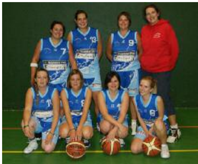
L'équipe des séniors filles