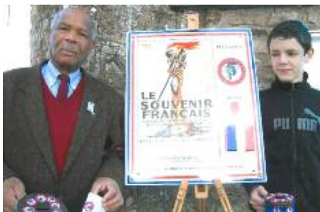
11 novembre 2011, quête du souvenir à l'entrée du cimetière