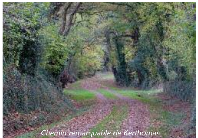
Chemin remarquable de Kerthomas