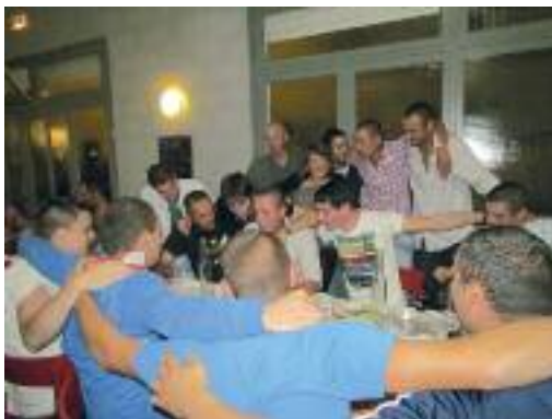
Les jeunes du club, reprenant la chanson de l'ASP