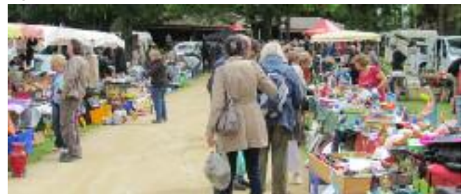
Troc et Puces du 10 Juin au terrain de la Madeleine organisé par la section animation (club des supporters).

Tout au long de la saison, ces membres préparent les casse-croûte pour les joueurs, servent à la buvette, organisent régulièrement un loto et un couscous à emporter.