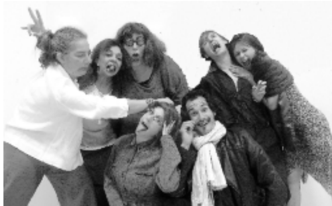
La troupe de Larscène

Larscène propose des ateliers théâtre le vendredi soir à la salle de la Madeleine : de 17h30 à 19h00 pour les adolescents et à partir de 21h00 pour les adultes.