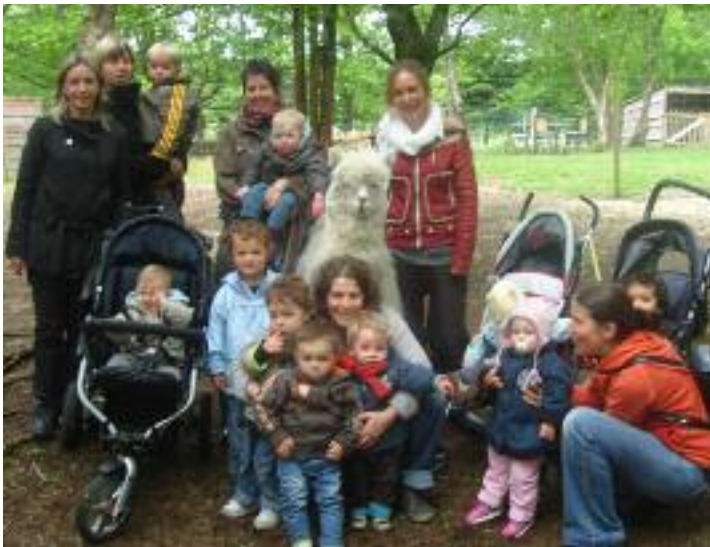
Les Bout'chou et Cie visitent la ferme de Kerporho

Forte d'une quinzaine d'adhérents, l'association est animée par les membres lors des différentes séances, chacun apportant ses connaissances ce qui enrichit et valorise les activités.