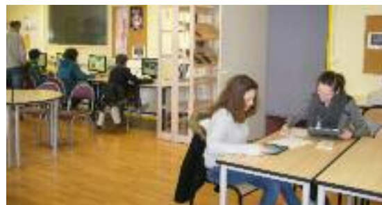
Enseignement du numérique en français