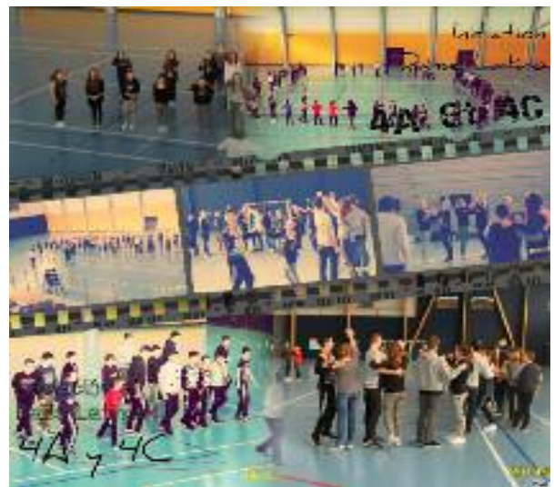
Initiation à la danse latino