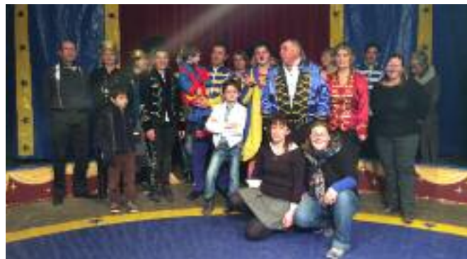
L'équipe pédagogique remercie chaleureusement l'Apel et l'Ogec, pour leur investissement dans ce projet audacieux ainsi que les parents bénévoles et la municipalité.

Puis les élèves sont venus, ils ont découvert et appris les arts du cirque. Quatre ateliers étaient proposés aux enfants : jonglage, équilibre, le fil et le trapèze. Ils ont tout essayé mais pour le spectacle chacun devait choisir une activité. Des semaines riches d'apprentissages. Des semaines fantastiques ! On a aussi découvert des talents cachés.