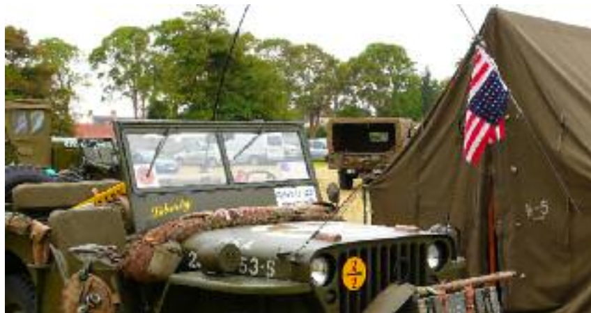
Le Camp Dobbins sera installé sur le terrain Saint-Michel.

Le dimanche, à 11h00, la population pourra assister à un défilé des troupes de la Libération (pensez à aller chercher des petits drapeaux dans les commerces!). Il sera suivi d'une cérémonie officielle à la Stèle Beats Me organisée par le Souvenir Français. Les Pluvignois sont invités à poursuivre la fête en participant dès 13h00 à un grand pique-nique populaire près du Camp Dobbins. Venez nombreux avec vos paniers !