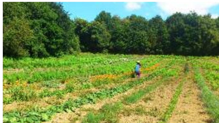
Le jardin des plantes de Kervily