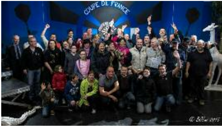
Une équipe de bénévoles très enthousiastes.

Le week-end des 3, 4 et 5 avril a vu se dérouler à Pluvigner un évènement exceptionnel : la Coupe de France de fléchettes. Exceptionnel à maints égards : organisation technique hors pair, engagement d'une soixantaine de bénévoles remarquables, qualité sportive des joueurs, engouement du public pluvignois!