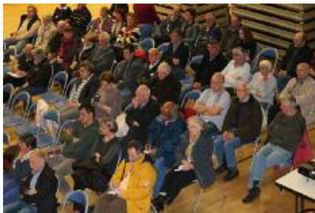
Les réunions publiques du mois d'avril ont attiré un public très attentif.

Chaque cas étant particulier, nous vous invitons à vous rapprocher des techniciens communaux et à rencontrer les élus en charge du dossier pour l'examen de votre situation personnelle.