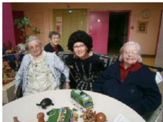
Les résidents ont apprécié les animations du groupe Bantou Na Bantou.