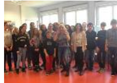
Théâtre en anglais