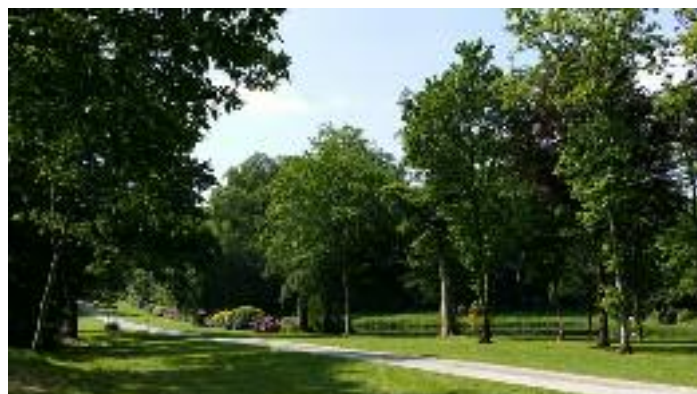
Le parc du château de Keronic

→ Le Jardin des créatifs : jardin astro-mythologique et agro-écologique. Scoulboch, Bieuzy-Lanvaux. Gratuit. Découverte le dimanche 7 juin de 10h00 à 12h00 et de 14h00 à 18h00.