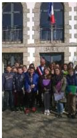
Les collégiens visitent la mairie