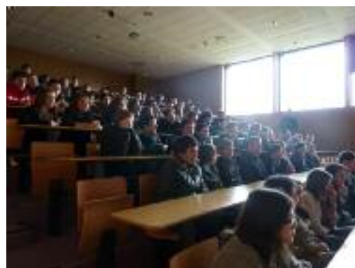
Les élèves de 4 ème ont visité les locaux de l'Université.