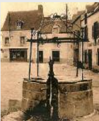
A Pluvigner, le crieur se tenait sur la pierre à côté du puits.

Paper ha kazetennoù kumun, internet... a zo daet da benn ag ar bannour. Atav ne vez ket mui kalz a dud en overenn kennebeut. Petra a chom anezhañ ? Ur maen bennak e korn magoar ar vered (ma n'eo ket bet lonket get ar parking), soñj troioù kamm bet c'hoariet d'ar bannour hag un nebeut troiennoù e lavar an dud. El-se, a pa guitaer unan bennak en ul lâret èl-mañ : "Ale, 'tak ar sizhun da zonet. Mar beemp bev atav..." e taper plaenik : "Oc'ho ! mar marvomp e vo graet ur bann !" Da lâret eo : tout an dud er gouio, ha te ivez.