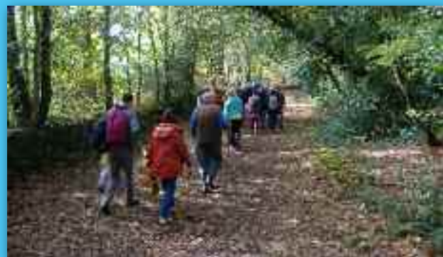
L'été dernier, sur les chemins ombragés ...

Tous les lundis du 7 juillet au 1 er septembre (sauf le lundi 14 juillet) en fin d'après-midi, l'office de tourisme de Pluvigner organise une randonnée afin de vous faire découvrir les circuits de la commune.