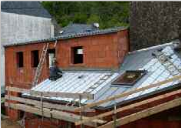
Les travaux d'agrandissement progressent vite.

L'ensemble de l'école tient à remercier tous les visiteurs de l'exposition LEGO qui par leur visite vont contribuer à l'aboutissement de ce projet.