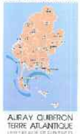
Panorama d'AQTA Communauté de communes

Alors même que les collectivités territoriales sont en pleine évolution, la grande intercommunalité est appelée à prendre un rôle majeur pour préparer l'avenir de notre territoire.