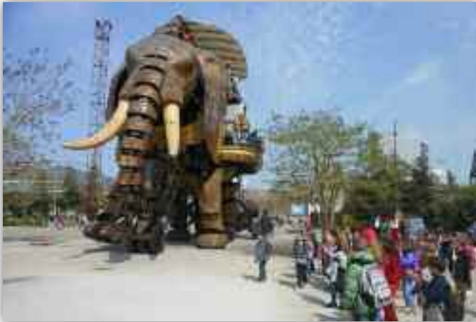
"Le Grand Eléphant", une des créations des "Machines de l'île"