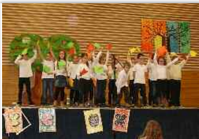
L'arbre de Noël de l'école Sainte-Anne