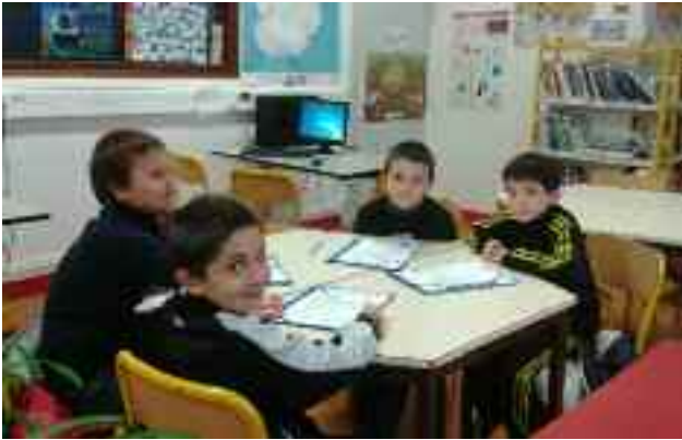
Découverte des locaux du collège