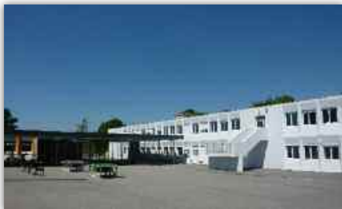
Le collège du Goh Lanno

→ L'ouverture sur le monde, le devoir de mémoire, la découverte du patrimoine :