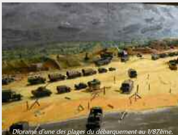
Diorama d'une des plages du débarquement au 1/87ème.

→ jusqu'au 20 juin : pour commémorer le 70 ème anniversaire du débarquement en Normandie, exposition d'une maquette/diorama de 3 m 2