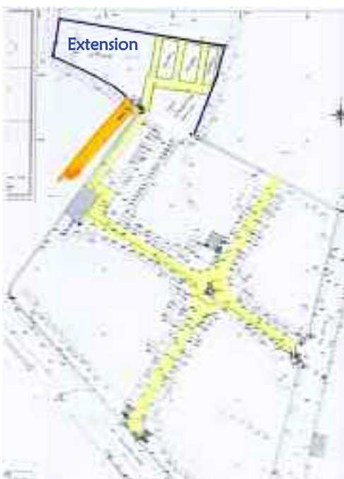
Plan de l'ancien cimetière et projet d'extension

Nous sommes confrontés à la réduction des espaces libres au cimetière. Une extension d'environ 1000 m 2 a été projetée au nord-ouest de l'existant. Les plans de l'ouvrage ont été établis. La consultation des entreprises sera lancée prochainement. La mise en œuvre devrait débuter en fin d'année.