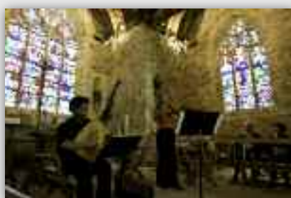
Les chapelles en concert cet été