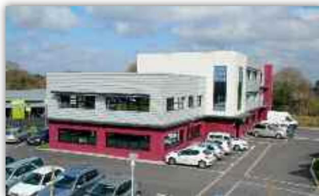
Le siège d'Auray Quiberon Terre Atlantique est installé dans la nouvelle zone d'activité tertiaire, Porte Océane 2 à Auray.

Pluvigner fait donc désormais partie de cette équipe de 24 communes chargée de porter le développement de notre territoire pour les années à venir.