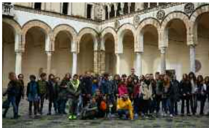
Voyage en Italie

→ L'ouverture sur le monde, le devoir de mémoire, la découverte du patrimoine :