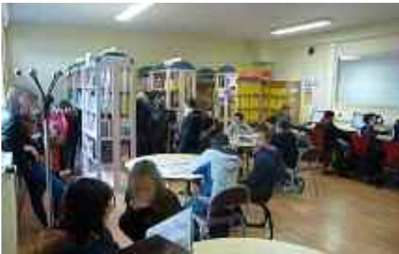
Le CDI du Goh Lanno