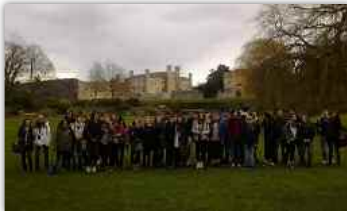
Voyage en Angleterre

• Dans la perspective d'une orientation ambitieuse, les élèves de 4 ème ont visité l'Université de Bretagne Sud le mardi 19 Mars. Ils ont également participé au Forum des Métiers au Centre Athéna d'Auray le jeudi 10 Avril et ont pu rencontrer plus de 75 professionnels.