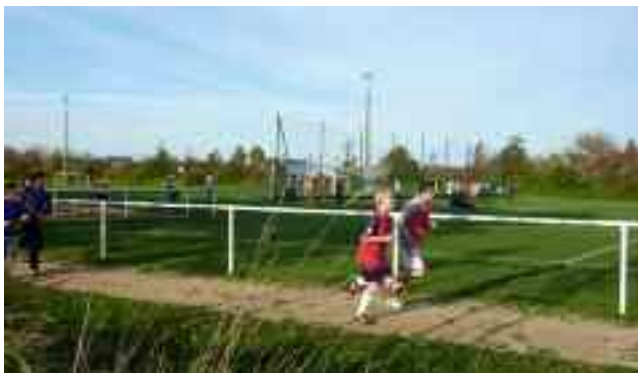
Cross du collège