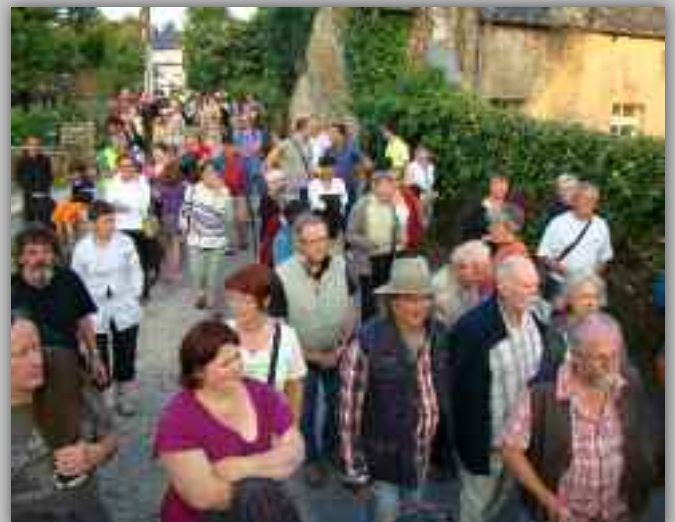
Tous les ans, l'animation attire de nombreux curieux.