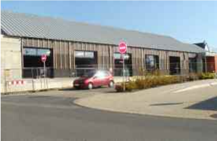
Les travaux du nouveau restaurant scolaire seront terminés en décembre.

La construction de cet ouvrage se poursuit. La planification du chantier est respectée. Nous devrions réceptionner ce chantier en décembre.