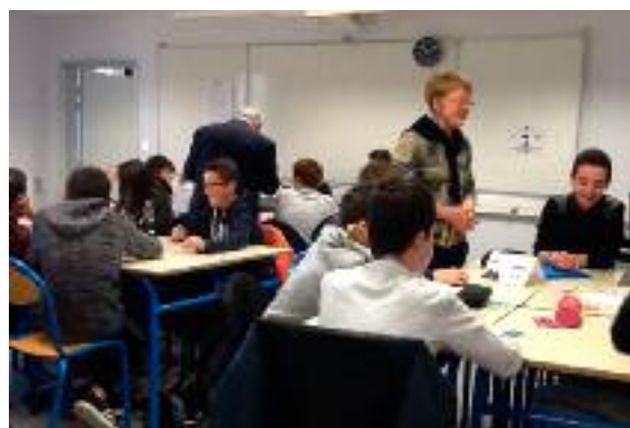
"Entreprendre pour apprendre" avec des élèves de 4 ème