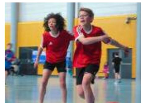
Tournoi ELA Foot