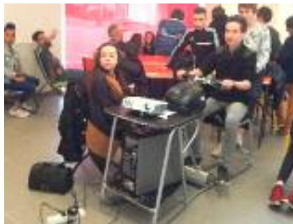
Prévention sécurité routière "simu-scoot"