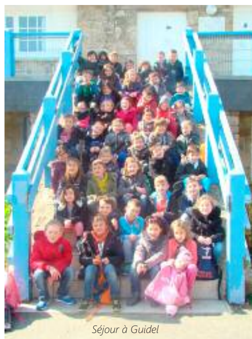
Séjour à Guidel

Avec 16 classes et une équipe enseignante dynamique et investie, les projets sont nombreux. Merci à tous nos partenaires, Mairie, Amicale Laïque, Récré Action, pour leur aide et leur soutien. Merci aux parents qui se rendent disponibles pour nous accompagner, leur présence est indispensable à la mise en place et à la réussite de ces projets nombreux et variés.