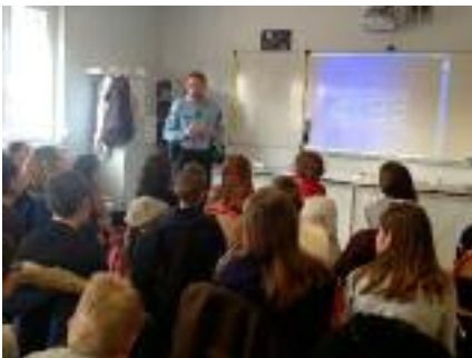
Prévention des incivilités