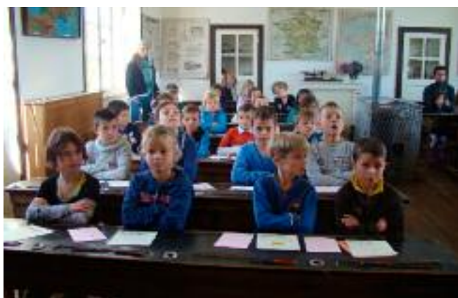
Musée de l'école de Botho