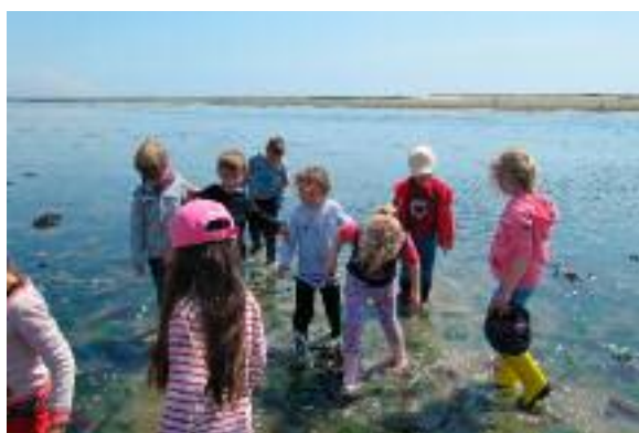
Ile de Kerner