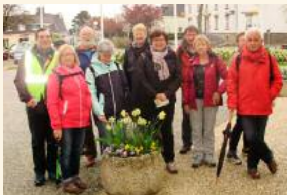
Les membres de Pluvi'Rando au départ de leur première sortie en avril dernier

L'association sera affiliée à la Fédération Française de Randonnée Pédestre (FFRP) à partir de septembre 2016 mais elle propose de vous retrouver dès maintenant sur les chemins, sous la responsabilité civile de chacun.