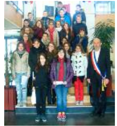
Visite de la mairie