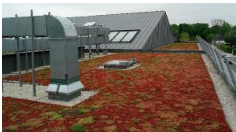
Vue du toit végétalisé du restaurant scolaire

Depuis la loi d'avenir agricole de 2014, les préfets peuvent prendre des mesures pour encadrer l'utilisation des pesticides dans certains secteurs plus à risque.