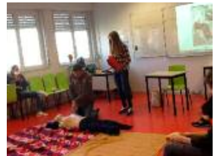
Prévention et secours civiques de niveau 1