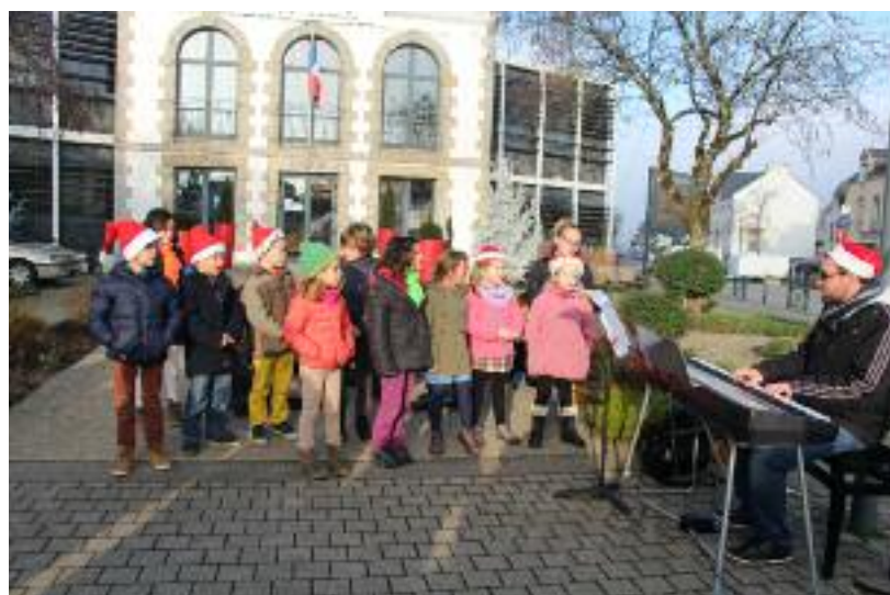
Les chants de Noël, interprétés par les jeunes chanteurs de l'école de musique