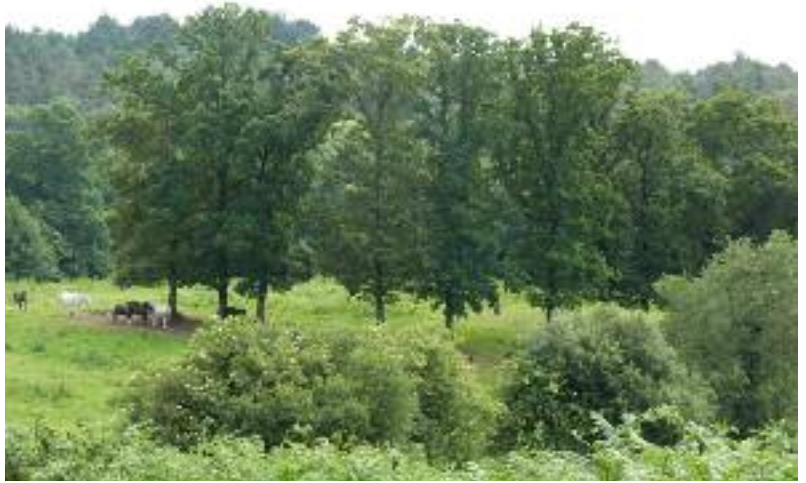
Trélécan / Cholo - arbres remarquables