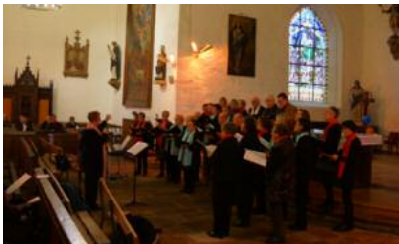
Concert chorales au profit du Téléthon 2016