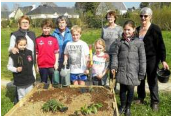
Des jardins pédagogiques avec activités compostage et jardinage pour une découverte ludique et pratique des cycles naturels et des chaînes alimentaires.

Pour les travaux de bricolage plus difficiles, les papis sont aussi mis à contribution !