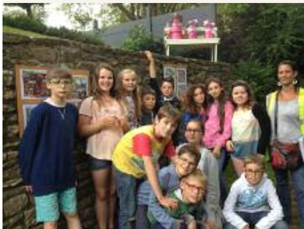
Toutes les écoles de Pluvigner se sont rendues sur le parcours des classes de CP jusqu'au CM2, avec une visite en deux temps : la découverte des oiseaux et des jardins pédagogiques ; puis les insectes dont les papillons et les frelons asiatiques. Les Mamm-Gozh ont initié les visites et le service jeunesse a pris le relais sur le mois de juin.

Ce parcours s'est enrichi de plusieurs créations au fil des mois : un hôtel à insectes, des nichoirs et mangeoires pour les oiseaux, des jardins pédagogiques, une jachère fleurie mellifère. Avec l'appui de la mairie, nous avons installé des panneaux signalétiques pour faciliter la découverte de ces différents espaces et de leurs "habitants", plantes et animaux de nos jardins.