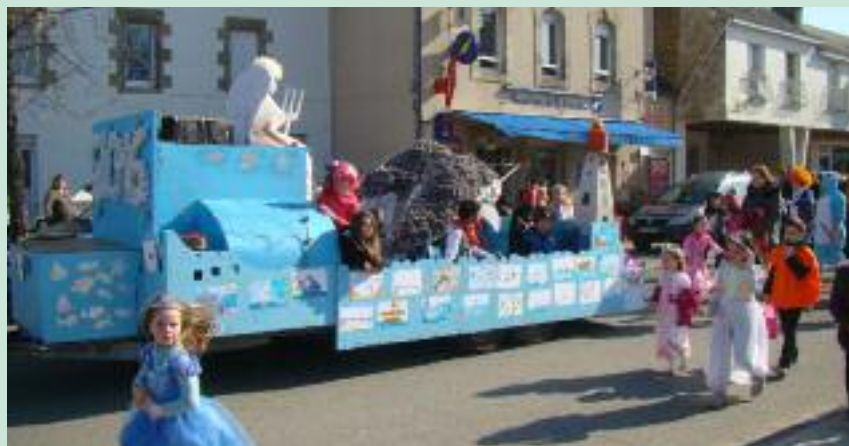
Le thème du Carnaval 2016 était "la mer"

L'association d'organisation du Carnaval recherche un groupe musical, dance, pour clôturer le carnaval mais aussi des bénévoles pour participer à ce projet festif. Bricoleurs et surtout confectionneurs de fleurs en papier sont particulièrement bienvenus.