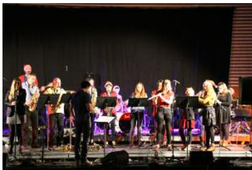
Concert de Noël à la salle Le Borgne