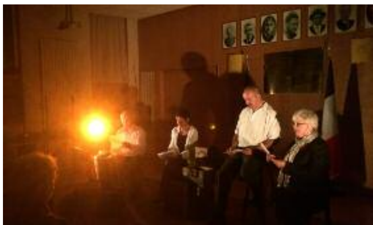
La Compagnie Mandarine rendant un bel hommage aux Poilus

L'inauguration de l'exposition a été marquée par une très émouvante et respectueuse lecture de Lettres de Poilus par les passeurs de mémoire de la Compagnie Mandarine de Brec'h.