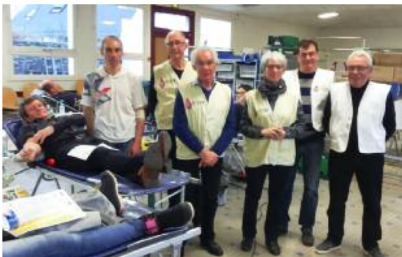
Quelques bénévoles lors de la collecte du 30 novembre 2016

Un don de sang est un geste précieux. Vous aussi, venez sauver des vies !