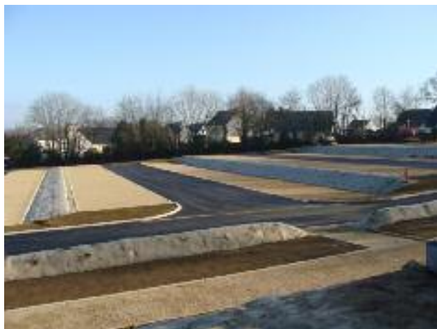
La capacité d'accueil du parking de proximité est de 180 places.